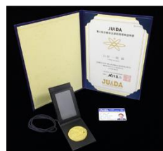
JUIDAが発行するライセンス