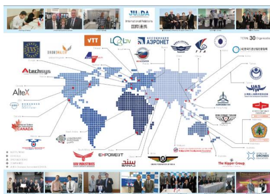
JUIDAが提携する世界各国の団体

また、世界各国のスクールとも多数連携しており、2021年1月末時点で全世界21か国30団体とMOUを締結し、カリキュラムに関する知見の共有を行っています。このような活動を通じて、ISOを通じて民間主導の国際ライセンスの制定についての検討を行っています。